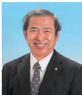
福岡大学国際センター長